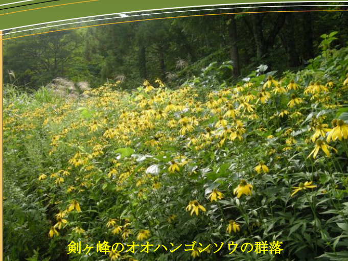
剣ヶ峰のオオハンゴンソウの群落

会津五薬師の中で北方に位置する漆薬師様は、北塩原村の代表的な宝です。そこには多くの宝があります。今回は、薬師本堂を右に回りこんだ上に修験道場でもあった奥の院・石英粗面の岩窟の霊場についてです。この岩窟には冬至の午前中だけ、奥まで陽が差し込むそうです。神秘的な空間をぜひ体験してください。今年こそ、冬至のときにチャレンジしてみたいかがでしょうか。