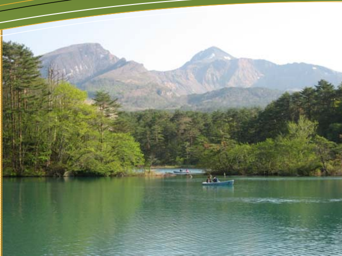
(写真) 新緑の毘沙門沼