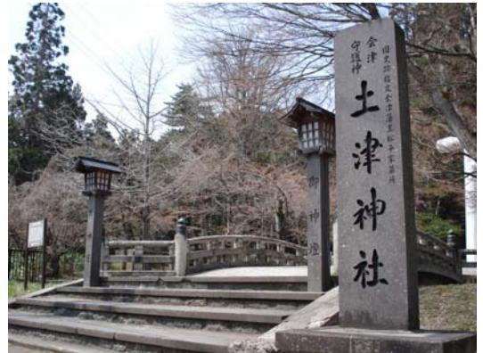
猪苗代町・土津神社