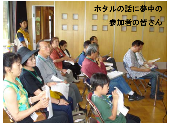
ホタルの話に夢中の参加者の皆さん

ホタルは綺麗な水のバロメーターと言われていることから、ホタルを守るにはどうしたらよいか、人間とホタルの共生できる環境が観光につながり、観光による体験が保護につながる事がすなわちエコツーリズムではないかとのお話しに、これからの活動に意をあらたにしました。ホタルの光ってほんとうに綺麗ですね。 記者：江花俊和