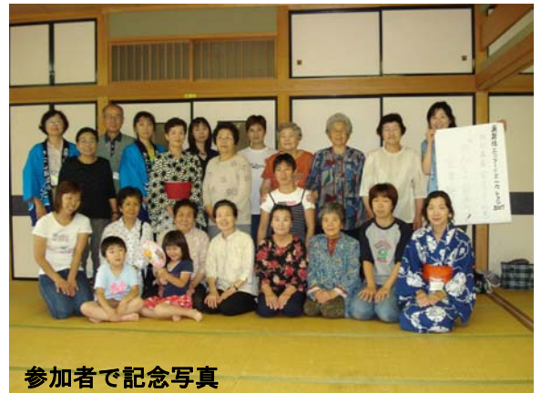
参加者で記念写真