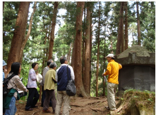
カレッジの様子：保科正之公の墓前にて

会津人に今も残っている怨念とこだわりが消えて、誇りだけが受け継がれる日が来るに違いない。」と講師の江花さんが会津人のココロに迫って最後にまとめておりました。